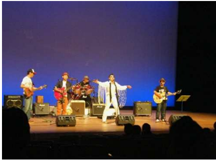
往年の大歌手になりきり

バンドのメンバーは50歳前後、あと5年もすると還暦の方もおられるようですが、激しい