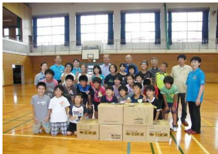
梱包した支援物資を囲み記念撮影