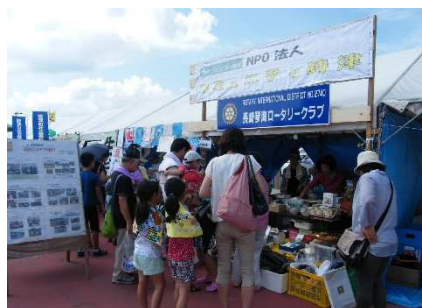
バザーのお店は開店前からお客さん

通りの時間厳守をしていたところ、突然“午後2時からの開店にします”という場内アナウンスがあった。半時間繰り上げの開店許可に、慌てる出店者もいた。