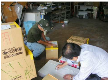
仕分け梱包・発送準備