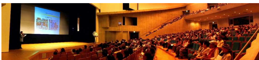
“とぎつカナリーホール”はほぼ満席 来場者 650 人

5 月 18 日（日）、長野県の諏訪中央病院 名誉院長 鎌田 實先生を時津町の“とぎつカナリーホール”にお迎えして、当法人の 10 周年記念講演会を開催しました。