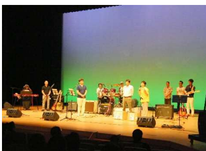
当法人のお礼のあいさつ

小学校の先生たちのバンド「はあとんぷ」の皆さんが、8月17日（日）、とぎつカナリーホールで「えんぴつ1本持ってLIVEを聞こう」と呼び掛けて、第7回チャリティーコンサ-